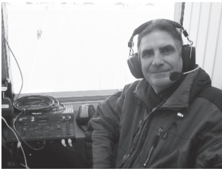
Több mint ezer mérkőzést közvetített

Pályája során 11 könyvet is írt. „Ígykeztem mindig tisztességesen elvégezni a dolgom, és csak azzal foglalkozni, amihez a legjobban értek: a sporttal. Örülök, hogy ez ilyen eredményekben gyümölcsözőt” – nyilatkozta a rádiós újságíró.